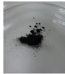
図 2 大気下における試料の写真

本研究課題で提案する電解質は災害時に安全で燃えることなく稼働し続けることができる特性を有さねばならない。一般的に化合物の劣化を最小限に抑えるために全ての作業は不活性ガスで満たされたグローブボックス内で行われる。本研究では電解質の合成後、大気下での安定性と安全性を確認するため敢えて大気中に開放しその時間変化を調べた(図 2)。試料は大気下において安定で、有毒ガス等の発生もなく安全な材料であることが示された。